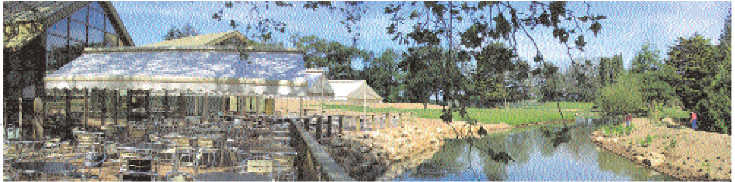
Tout en bois, le restaurant s'intègre dans l'environnement et s'ouvre sur le parc animalier.

Le projet architectural du pôle Branféré est construit autour d'un ensemble de bâtiments qui visent les cibles Haute Qualité Environnementale (HQE) et répondent à une triple exigence de cohérence : harmonie des bâtiments entre eux, cohésion avec la nature mais aussi avec l'histoire architecturale du Pays de Muzillac.