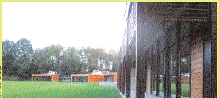
L'École Nicolas Hulot : au premier plan les salles pédagogiques, en arrière plan les modules d'hébergement.

L'École Nicolas Hulot a été conçue selon une démarche écologique visant les cibles de Haute Qualité Environnementale. Cinq cibles ont fait l'objet d'un traitement approfondi : intégration des bâtiments dans l'environnement immédiat, recours à des procédés et des matériaux de construction respectueux de l'environnement, maîtrise des énergies, de la gestion de l'eau et des déchets, confort lumineux et hygrométrique maximal.