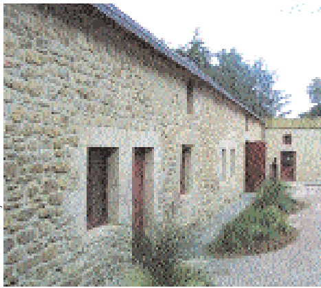
L'accueil du pôle, aménagé dans le corps de métairie

Outre le château du XIX ème siècle, à l'intérieur du parc, progressivement restauré à l'ancienne, une vision résolument moderne a été donnée par l'architecte Jean de Gastines aux nouveaux édifices ouverts au public depuis l'été 2004. Le visiteur découvre des matériaux novateurs et peut apprécier l'association originale de matières comme le verre et le bois. C'est ainsi que l'espace d'accueil du public et les locaux administratifs ont été installés dans un vieux corps de métairie entièrement rénové. À proximité, un restaurant panoramique au style contemporain offre 350 couverts, dont 200 en terrasse, avec vue sur le parc animalier. Ici aussi, le projet porte son idée de biodiversité jusque dans le choix des menus (produits locaux, agriculture raisonnée...).